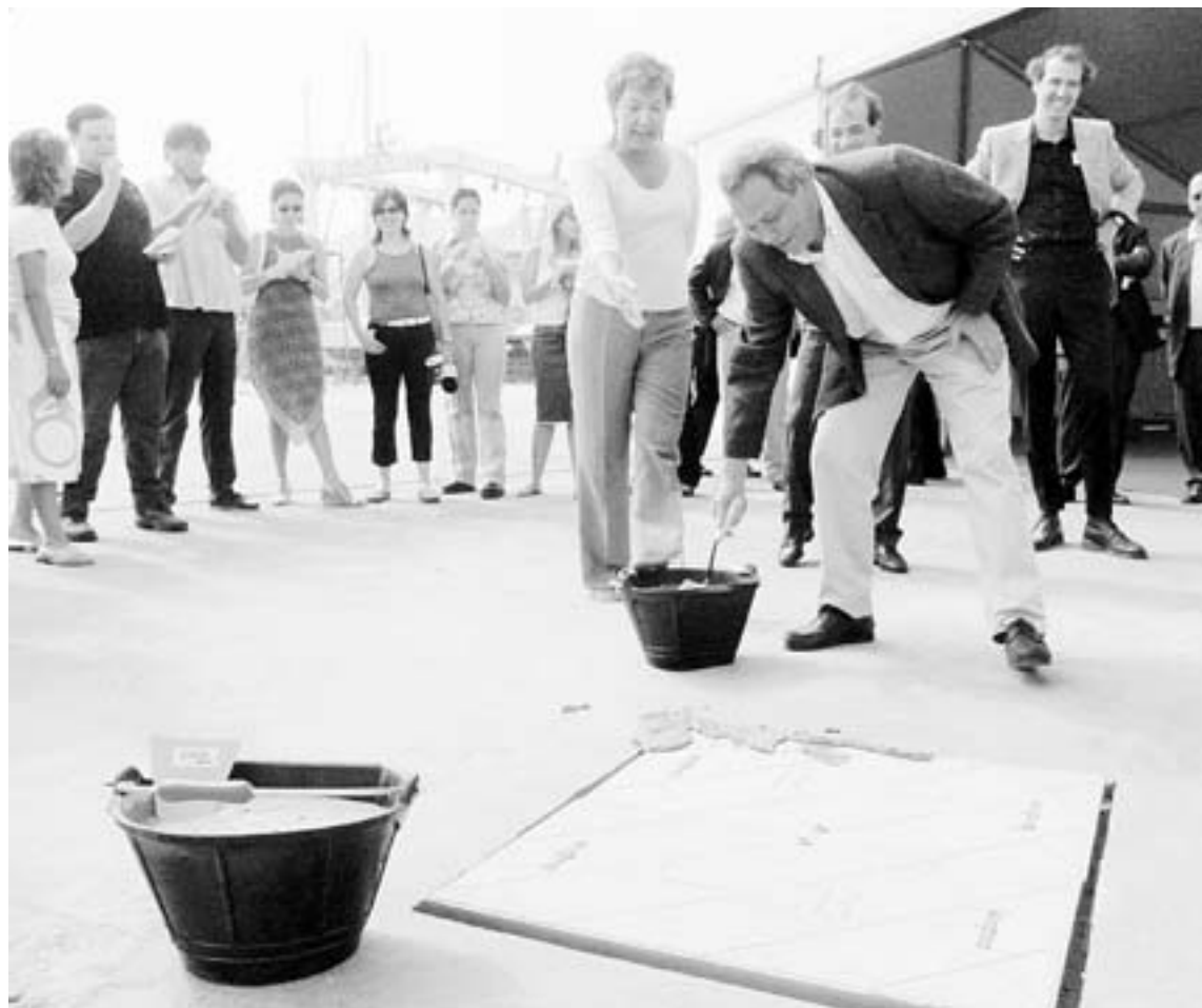
PRIMERA PIEDRA. El concejal de Urbanismo pone cemento ante Barreiro.

Barreiro no pudo ocultar su satisfacción porque este proyecto ha salido adelante y mostró su apoyo a los arquitectos, «porque vamos a demostrar que algo que