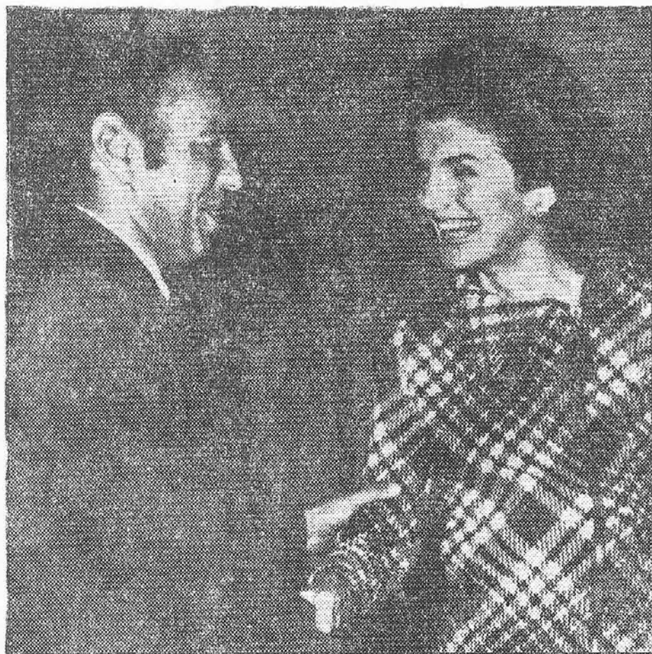
NUEVA YORK.—Jacqueline Kennedy saluda al rey Hassan de Marruecos, a quien recibió en su domicilio de Nueva York. El monarca marroquí se encuentra en visita oficial en Estados Unidos desde hace varios días.

Declaraciones del ministro de Agricultura