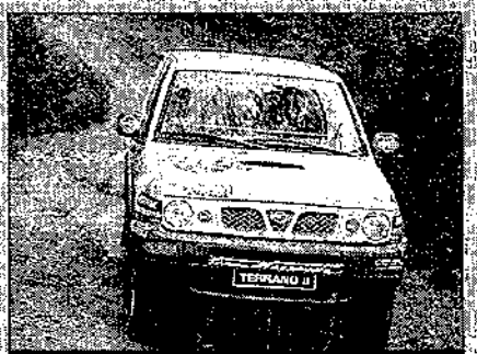
Nissan «Terrano II» de la aventura.

La vigésima edición del Rallye París-Dakar pretende volver a los orígenes y, como ocurrió el día 1 de enero de 1979, un nutrido grupo de aventureros se lanzarán a la mayor aventura deportiva del mundo de la automoción. Los 352 participantes, entre coches, motos y camiones, tendrán ante sí un recorrido de 10.245 Km. de los cuales 6.388 Km. serán de pruebas especiales y 3.857 Km. serán de enlace. Para Nissan Motor España, esta vigésima edición del París-Dakar tiene una notable importancia, ya que por primera vez los «Terrano II» afrontarán de forma oficial esta dura competición. Por ello, la marca ha preparado dos programas diferentes: el primero es el clásico de presentar un coche oficial en la categoría T2 y el segundo es más original y se ha denominado «La Aventura Nissan» Dakar '98. Con esta aventura la marca ha querido dar una oportunidad única a aquellos pilotos aficionados que quieren vivir una experiencia irrepetible en África. Algunos de ellos ya han participado en esta prueba, ya sea en coche, camión o moto, pero han querido regresar haciendo esta vez encuadrados en un equipo bien estructurado, con una asistencia oficial prestada por los expertos hombres de Bessoude y bajo el común denominador de los «Terrano II Turbo Diesel». Los equipos integrados en la «Aventura» compuestos por diez equipos españoles y dos portugueses, competirán en la categoría T1 reservada a vehículos muy próximos a los de serie.