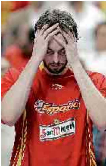
PAU GASOL , tras perder la final del Eurobasket el pasado domingo.

Yo no digo que Zapatero no tenga su parte de culpa, culpita o culpona, en algunas cuestiones concretas. Sin embargo, como decía el maestro: «Lo que no puede ser, no puede ser, y además es imposible». Si Zapatero sube el tanto por ciento de las pensiones más que sus predecesores o mantiene las previsiones económicas de crecimiento por encima de los demás países europeos, quien diablos tiene la culpa. Pues el diablo por ser diablo.