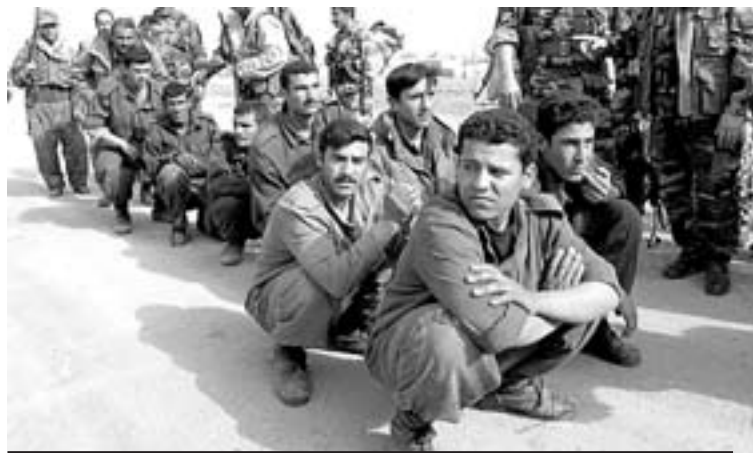
DETENIDOS. Soldados iraquíes retienen a ciudadanos kurdos.

Las tropas iraquíes del frente Norte se están reagrupando alrededor de las instalaciones petrolíferas de Kirkuk y Mosul, después de una semana de repliegues ante el avance de 60.000 peshmergas y 3.000 paracaidistas estadounidenses. Los guerrilleros kurdos han demorado el asalto a ambas ciudades con el fin de aislar primero a dichas guarniciones.