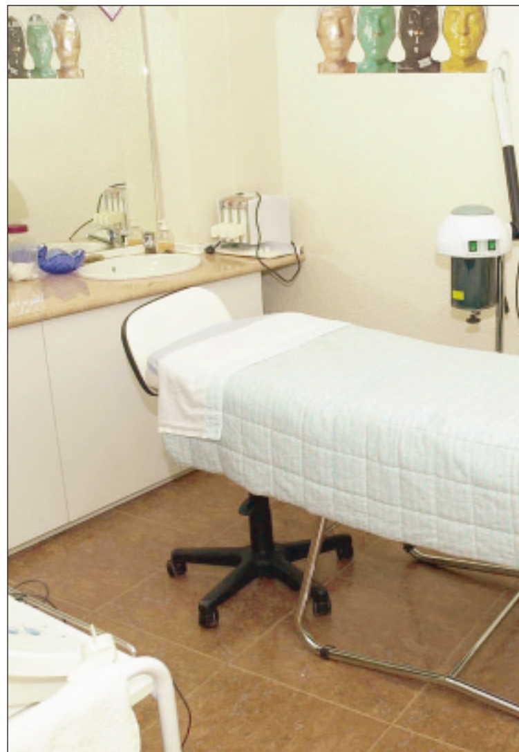
Sunmarine ofrece gran variedad de productos de aromaterapia.

La bisutería es otro de los campos que aborda Sunmarine , donde hay una extensa oferta de colgantes, pulseras, pendientes y anillos, ideales para cualquier situación en la que se tenga que hacer frente a un regalo; aunque también se ofrecen numerosos artículos, a cada cual más original, para quedar estupendamente con familiares y amigos. Estos productos van desde quemadores de esencias a portafotos, juegos de incienso, bolas de gelatina, carteras de piel, velas con ambientador, sales de baño, artículos de masaje contra el estrés, agendas de teléfonos, inciensarios y esponjas. Toda una variedad de productos para todos los gustos y olores de los lorquinos.