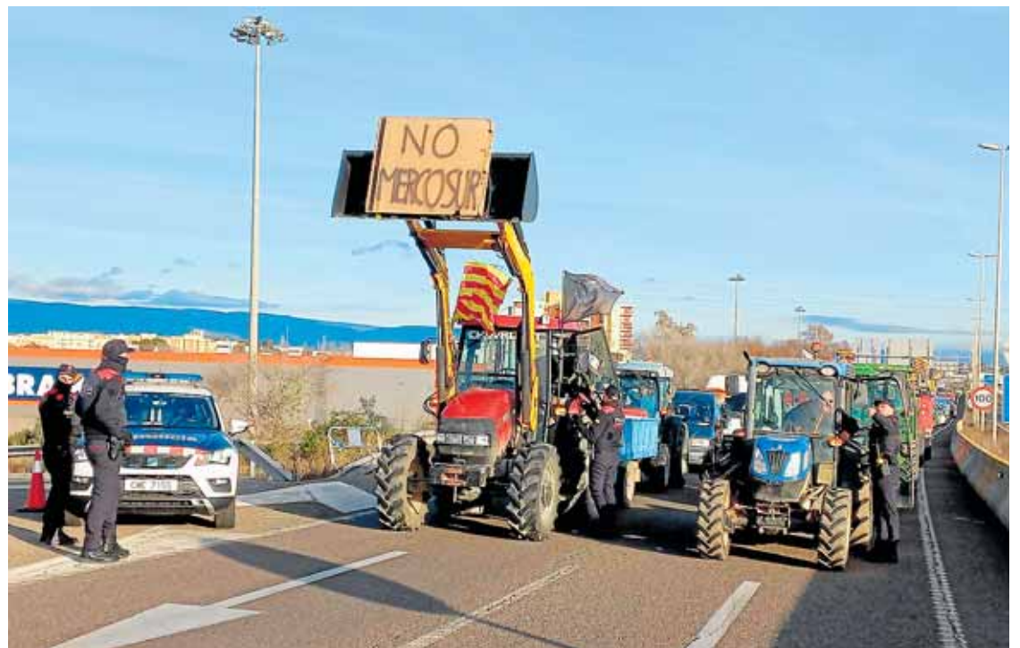
Medio centenar de tractores bloquearon ayer el acceso al puerto de Tarragona.

Hasta el cierre de la operación, Moeve y Galp seguirán operando como compañías independientes, con plena continuidad de sus operaciones, suministro y servicios a clientes en todas las actividades y geografías.