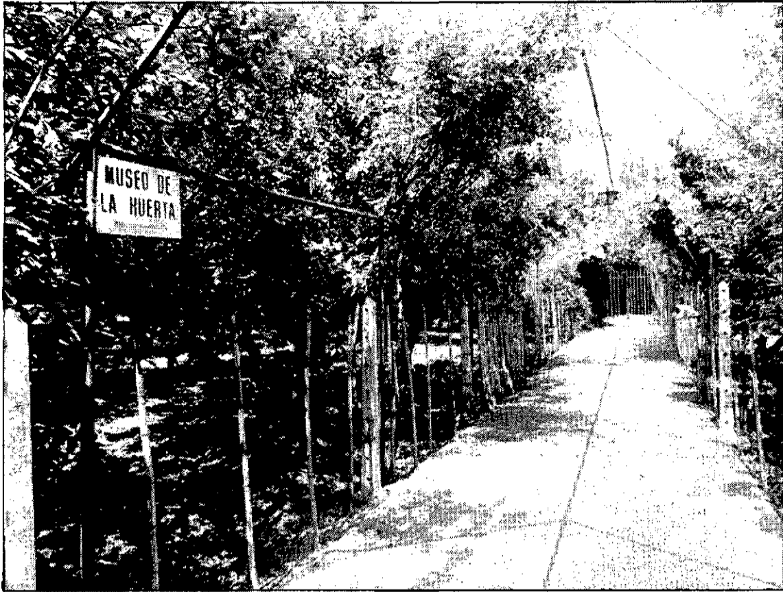
La muestra del Museo de la Huerta será los más destacado de la jornada del municipio en la Expo.