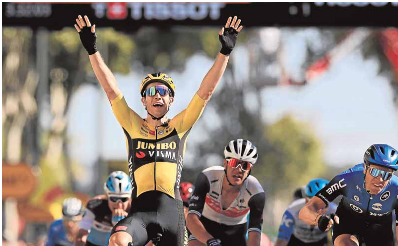
El belga Wout van Aert gana en Lavour su segunda etapa en este Tour.

A Landa le sigue mirando de reojo la fortuna. Le quitó a un gregario el primer día, Rafa Valls, con un fémur partido. Le ha machacado a otro, Wout Poels, que arrastra una costilla rota. Y, para colmo, se le caen tres de los suyos en el momento clave de esta etapa. «Es que estamos corriendo con seis y nos caemos tres. Llevamos todo el Tour delante y...»,