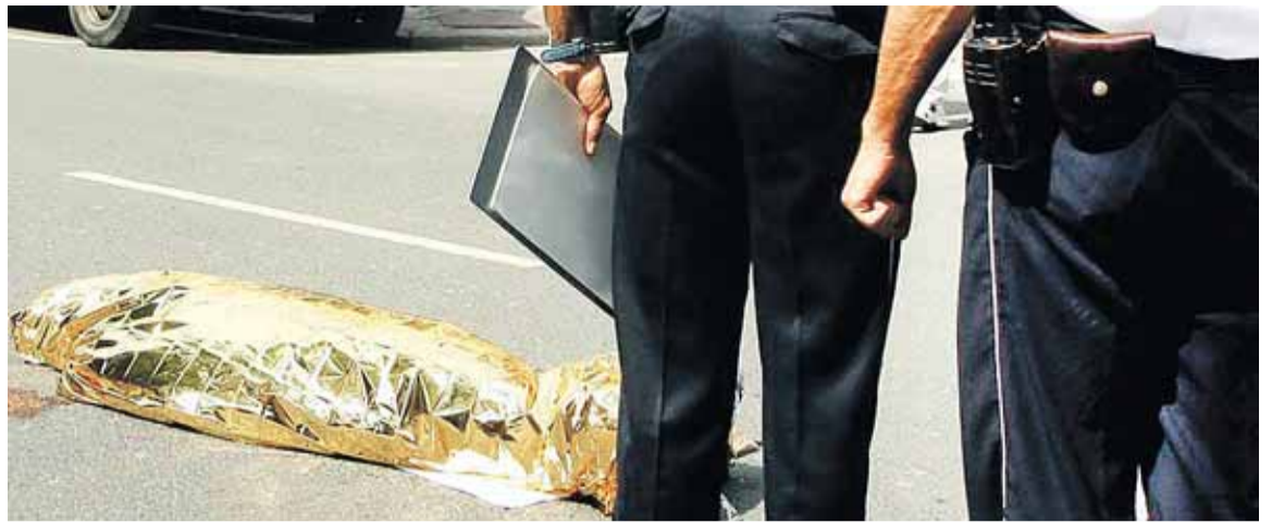
El cuerpo de un peatón atropellado yace en una calle.

En lo que respecta a los conductores, el informe de Toxicología destaca que de los 615 muertos en accidente, 291 (el 47,3%) tenían restos de alcohol, drogas y fármacos. De estos fallecidos, el 74,23% habían ingerido alcohol, el 26,8% drogas y el 28,52% fármacos psicotrópicos.