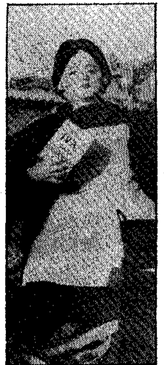
Como en años anteriores, las fallas han cautivado la atención de los pinatarenses.