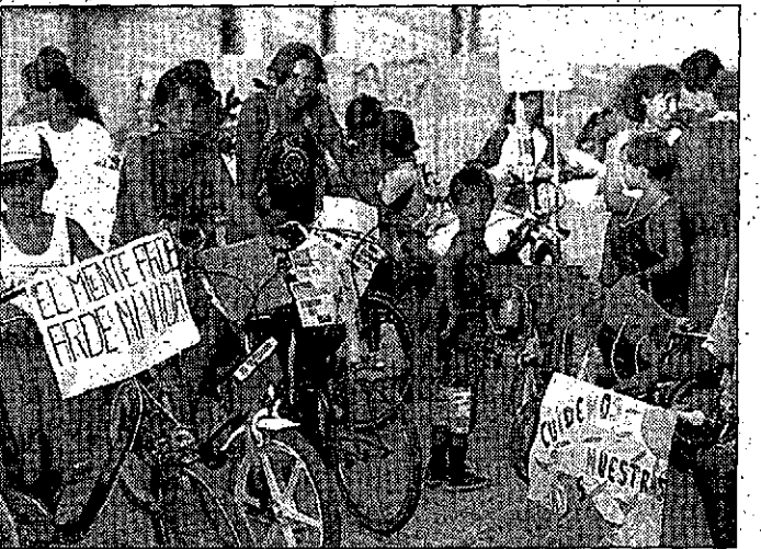
Un grupo de veraneantes, en las fiestas del año pasado.