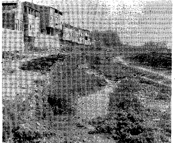
La foto se comenta por sí sola. Los vecinos, además tienen que oler los efluvios de las aguas.

Indica que podría costar unos tres millones de pesetas y estar terminado en quince días, aunque por supuesto, esto no sería más que un parche. La solución definitiva sería la construcción de depuradoras en los pueblos de la cuenca.