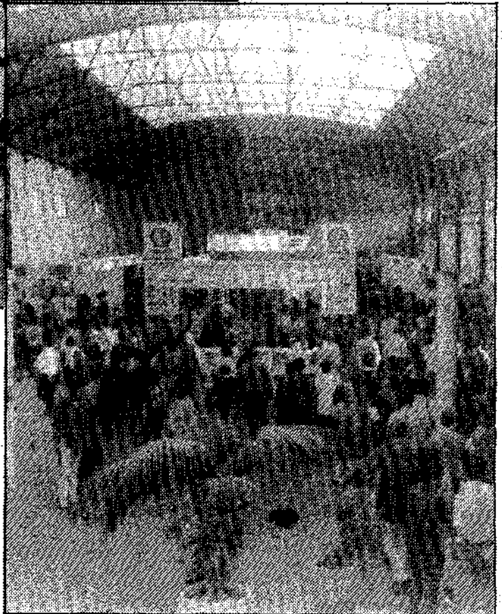
Interior del recinto.