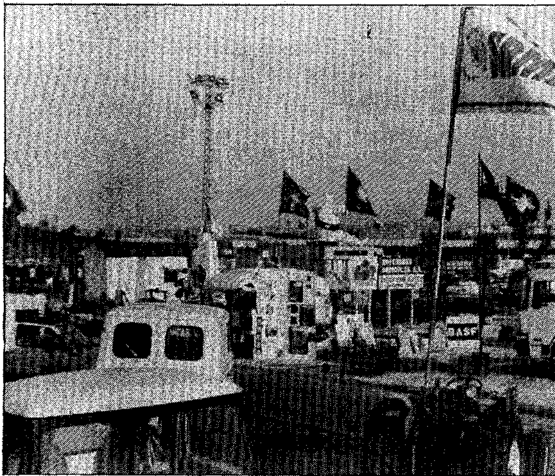
Exterior del recinto.