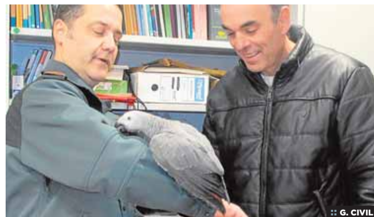
:: G. CIVIL

Las víctimas tenían entre 13 y 15 años cuando se produjeron los hechos