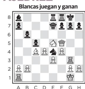
Partida: Grünfeld-Wagner (Austria, 1929).