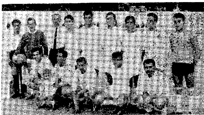
Este es el equipo del Jumilla que se desintegró hace 10 años.

JUGARA EN UN CAMPO SITUADO EN EL BARRIO DE LA ESTACADA