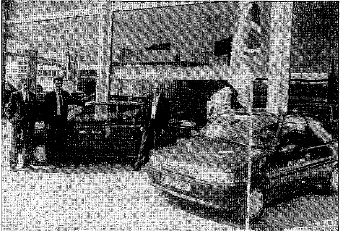
Los Peugeot «106» a las puertas de AUSSA en el momento de la entrega.