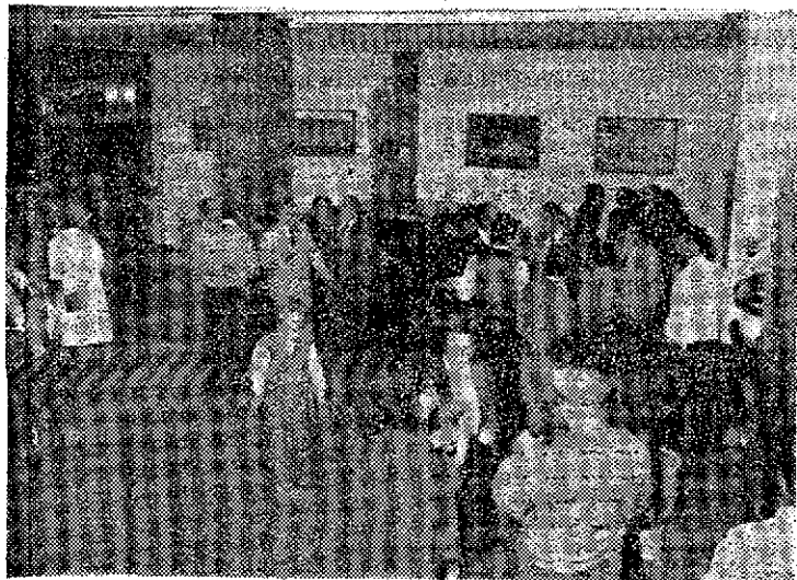
Numerosas personas asistieron a la presentación. La oferta del VOLVO es ahora de 25 modelos en sus tres gamas: 300, 200 y 700.