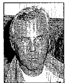
► Giorgio Armani , diseñador, 62 años.