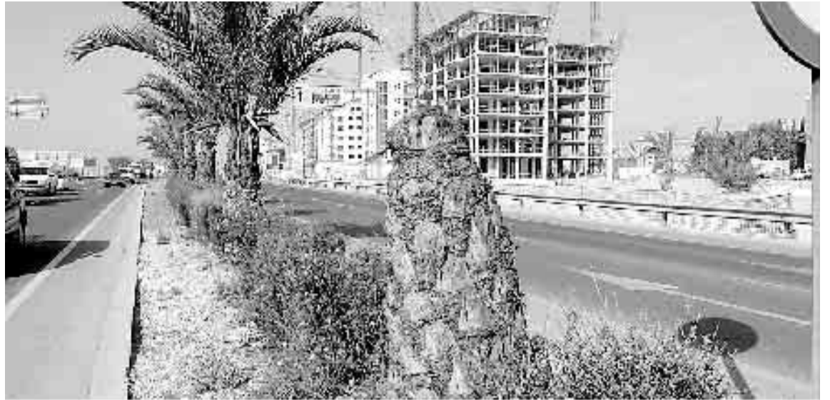
TRISTE IMAGEN. Una de las palmeras de la mediana de Ronda Sur, cortada por la mitad.