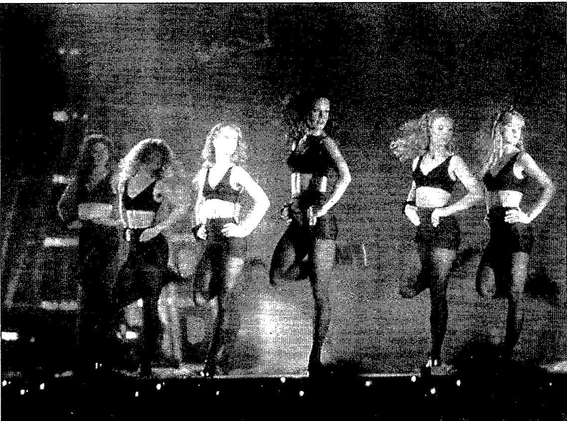
Un momento del espectáculo de The Lord of the Dance.

El espectáculo creado por Michael Flatley ha sido visto por dos millones de espectadores en todo el mundo