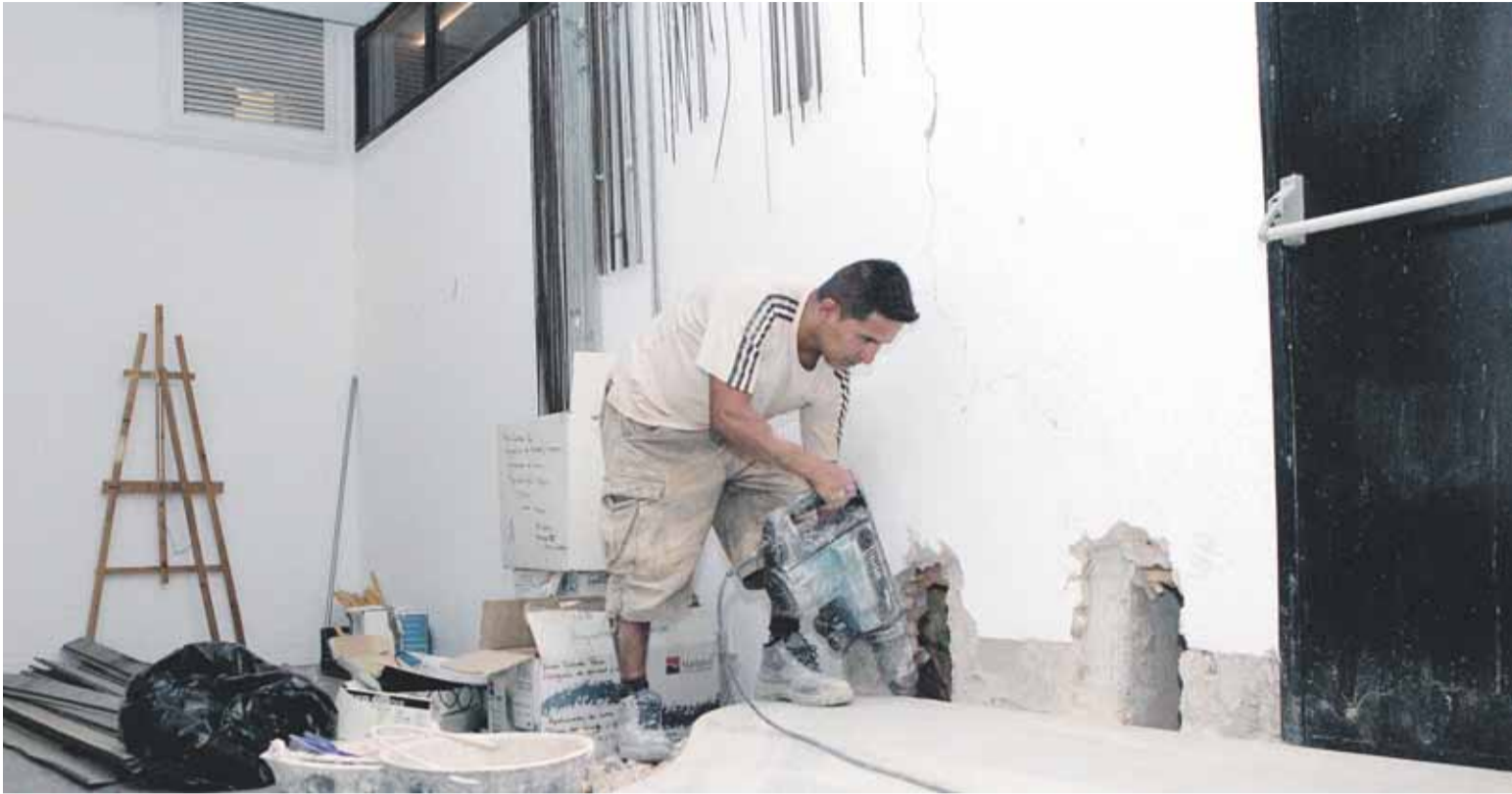
Un operario descubre pilares dañados por los seísmos para llevar a cabo su arreglo, ayer, en el centro cultural