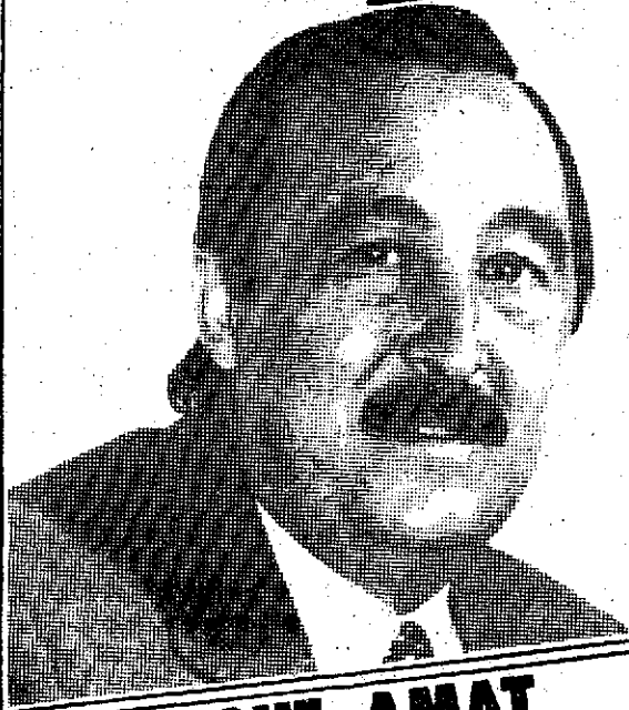
ENRIQUE AMAT SECRETARIO GENERAL DEL PSRM PSOE Candidato al Congreso

espacio electoral telemurcia hoy a las 14,20