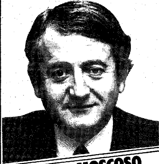
JAVIER MOSCOSO MINISTRO DE LA PRESIDENCIA Candidato al Congreso