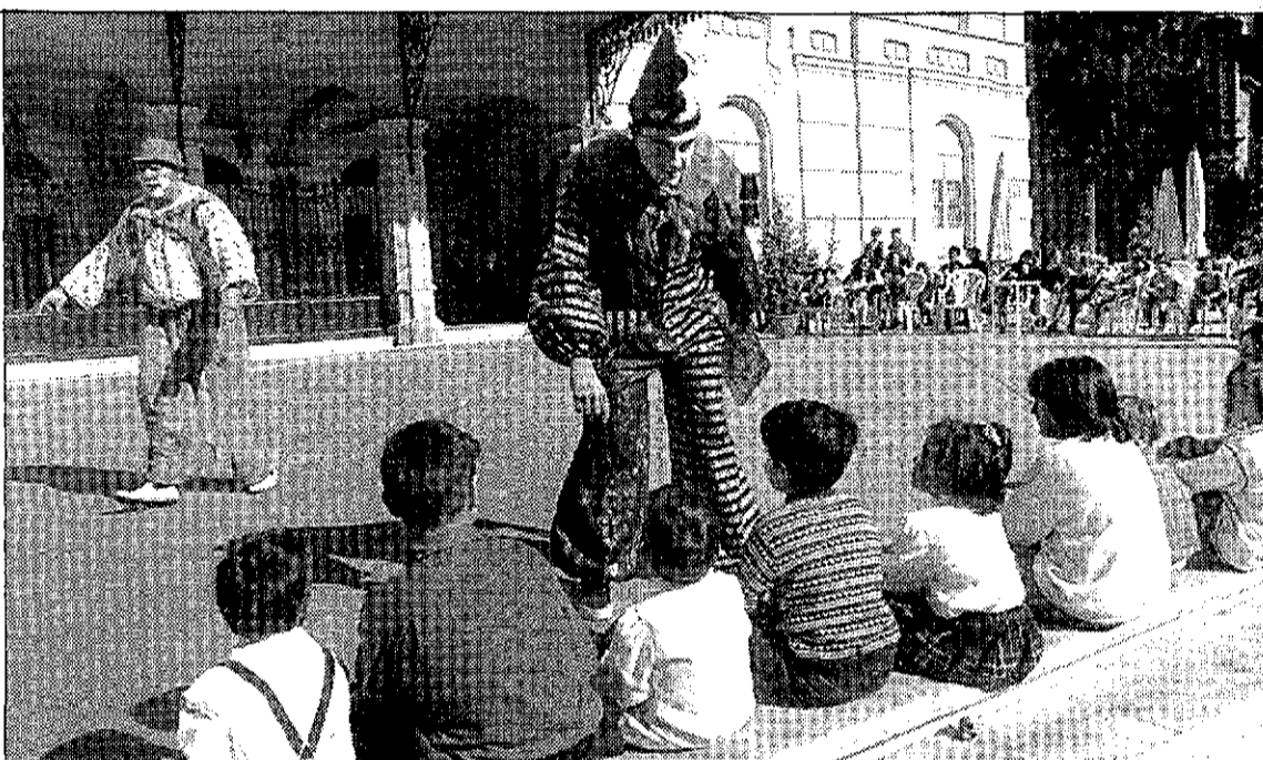
Animar a los niños a que lean más Con motivo de la Feria del Libro Antiguo y de Ocasión, que se celebra en Murcia, el grupo La Murga ofreció el pasado domingo un espectáculo, en la plaza del Romea, de animación a la lectura para escolares, momento que recoge la imagen.

rias, pero habiendo fallecido su padre, y deseosa de estar cerca de su anciana madre -o acaso también por añorar su tierra murciana-, ha regresado a sus lares, y se ve obliga-