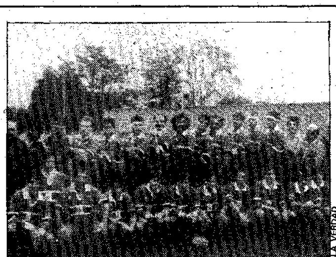
El Villeurbanne de rugby que se enfrentará a la Universidad de Murcia.

Dice también que por este año será imposible formar el grupo XIII exclusivamente con equipos murcianos debido a la circular enviada por la Federación Española y de la que no se ha hecho eco la Regional Murciana. Para el próximo año lucharía por ello de salir elegido. Podría haber dos grupos de Preferente con 36 equipos, 18 de la actual, 10 de la Liga Autónoma y ocho de primera regional. Añade que en lo económico contaría con el apoyo de la Federación Española.