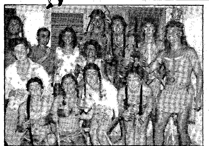
En la discoteca «Mundo Noche»