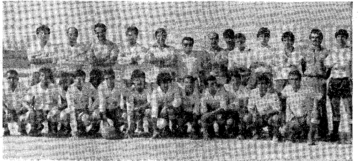
Plantilla del Fuente Alamo, al comenzar la temporada, con sus directivos y entrenador.

—Sí, nos afectó mucho. Yo no desprecio al contrario, pero pienso que en la primera parte pudimos ganar el partido. Tuvi- mos seis o siete ocasiones claras de gol. Ellos, en la segunda parte le echaron mucho coraje. Aparte, el campo no reunía condiciones. Es pequeño y más bien parecía