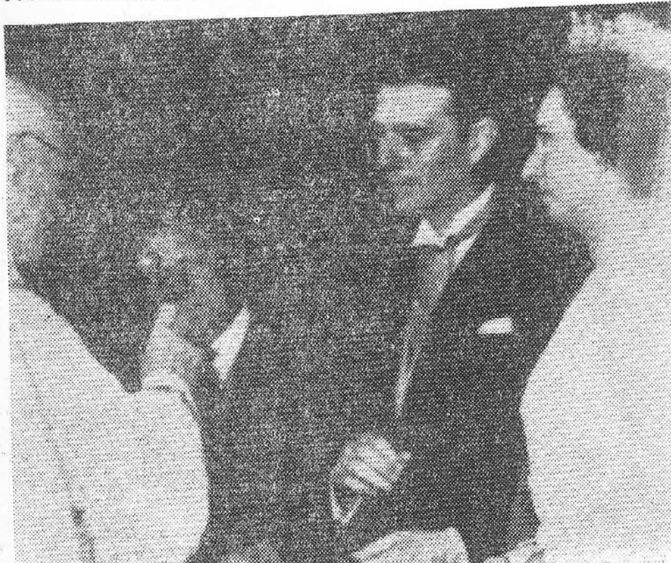
LISBOA.—Momento de la bendición del enlace matrimonial de la infanta doña Pilar de Borbón.—(Telefoto deEUROPA PRESS).

Linde IBÉRICA VITRINAS PARA PRODUCTOS CONGELADOS