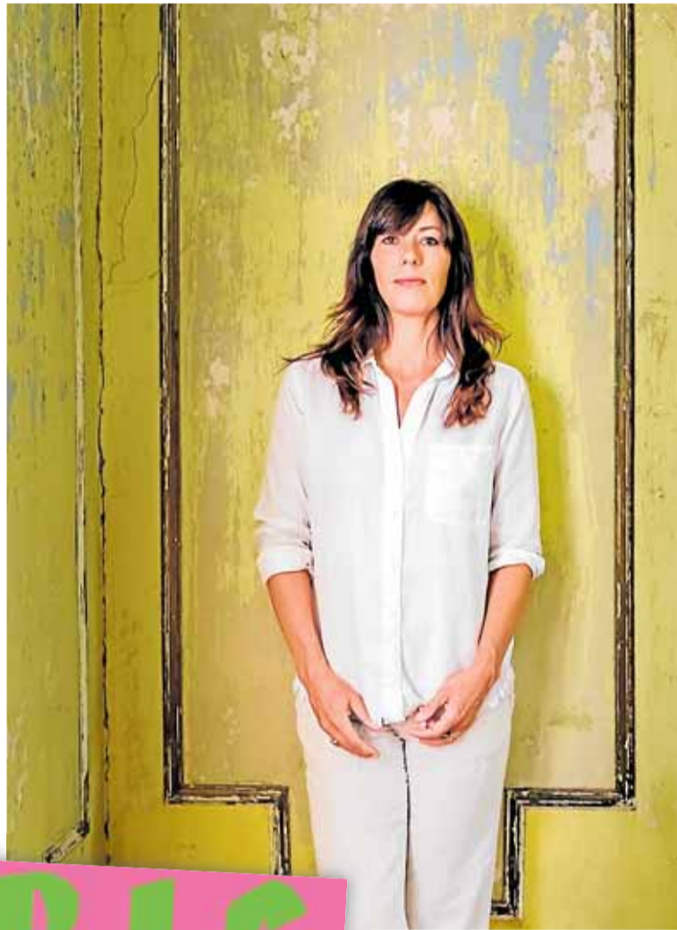
La escritora Jen Beagin (Torrance, California, EE UU, 1971).