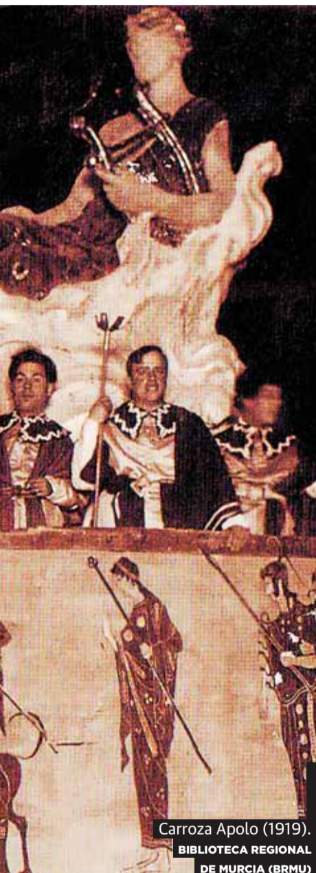
Carroza Apolo (1919).