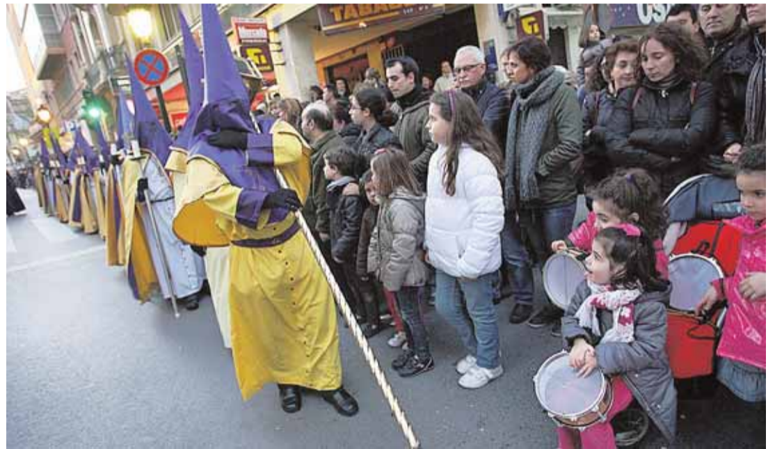
▲ Cada día. La cofradía de Nuestro Padre Jesús Nazareno participó en el Santo Entierro con el Descendimiento y la Piedad.