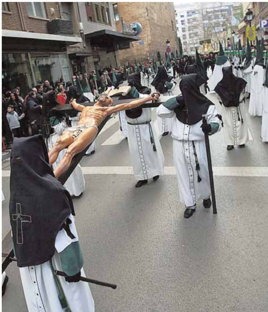
▲ De luto. Costaleros del Cristo de la Buena Muerte, de La Macarena.

► Encuentro. A las 11 horas. Plaza de Benjamín Palencia. Tras el encuentro entre el Resucitado, Nuestra Señora del Mayor Dolor y Santa María Magdalena, todas las cofradías desfilarán por la Avenida de España, plaza de Gabriel Lodares, calle Ancha, plaza del Altozano, Martínez Villena a la Catedral.