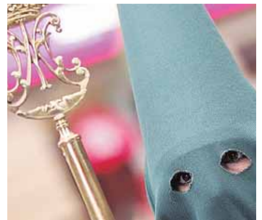
▲ Fervor. Cofrade de La Macarena, identificado por su típico capuz verde y la eme mariana de su báculo.