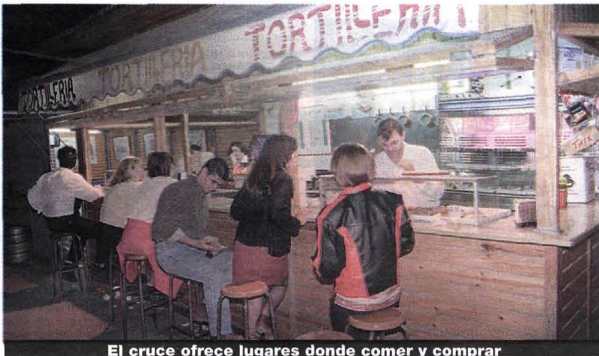
El cruce ofrece lugares donde comer y comprar