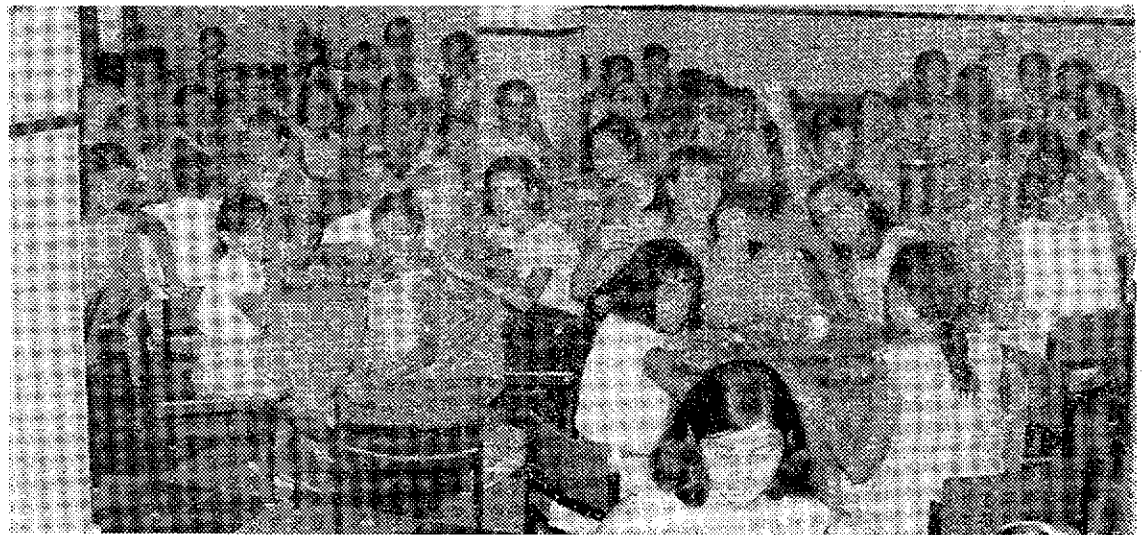
Unos 550 niños pasarán sus vacaciones en colonias de la región.

Se aprende teatro, natación, socorrismo, etc.