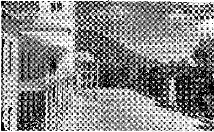
Uno de los albergues para escolares en Sierra Espuña.