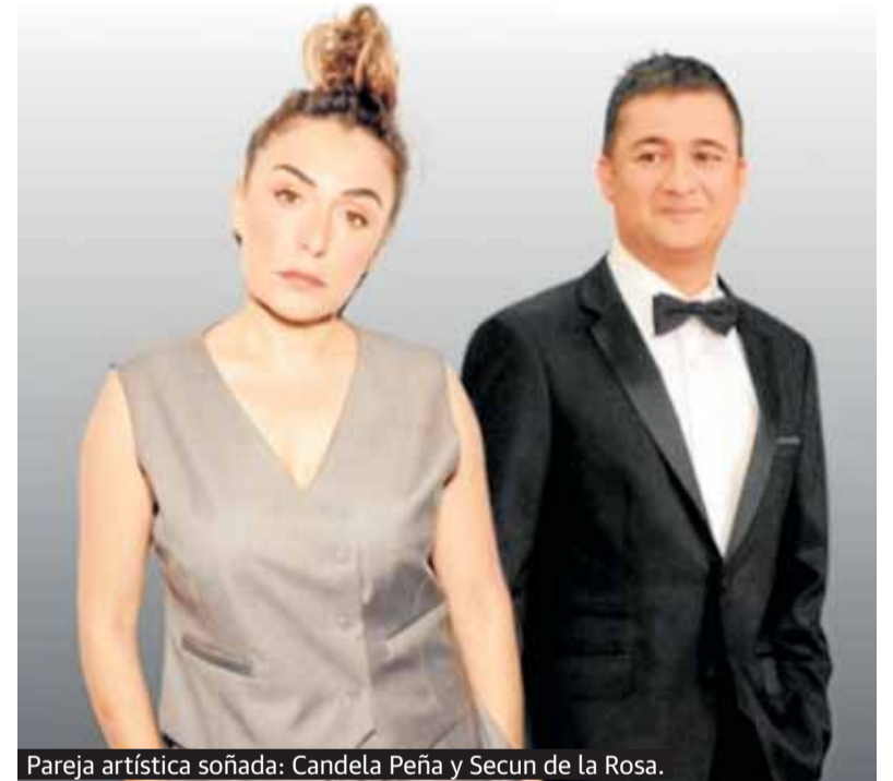
Pareja artística soñada: Candela Peña y Secun de la Rosa.

eso se trata en 'Peña+Peña', un espectáculo irrepetible. Literalmente. Cada una de las cosas que sucedan sobre las tablas del Auditorio y Centro de Congresos El Batel durante el mediodía del próximo domingo quedarán guardadas exclusivamente en la memoria de las personas que ocupen su localidad y el recuerdo de la protagonista, entre otras joyas, de 'Princesas', 'La boda de Rosa', 'Ayer no termina nunca' o 'Torremolinos 73', y un Secun de la Rosa que el pasado año nos deslumbró en la serie 'Superestar' con otra excepcional interpretación que incorporó a su lista. Como un truco de magia a cuatro manos, dos lenguas y un par de cerebros incontenibles. Candela y Secun. Secun y Candela.