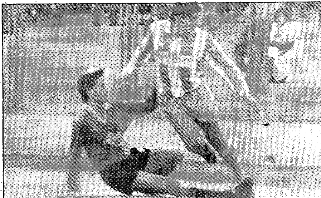
El gol de Diego en Teruel ha devuelto las esperanzas al Lorca.