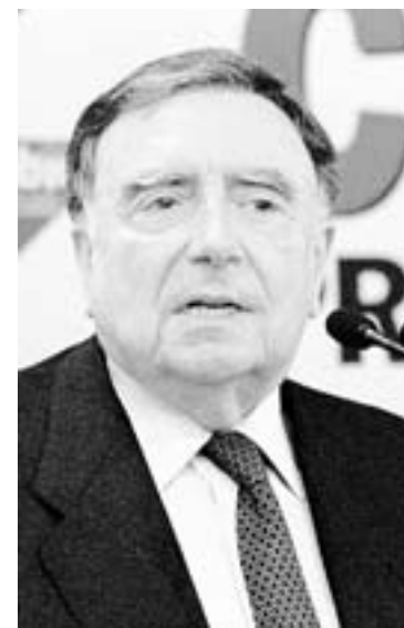
Luis María Anson.

Fuentes consultadas indicaron que el tipo de artefacto utilizado