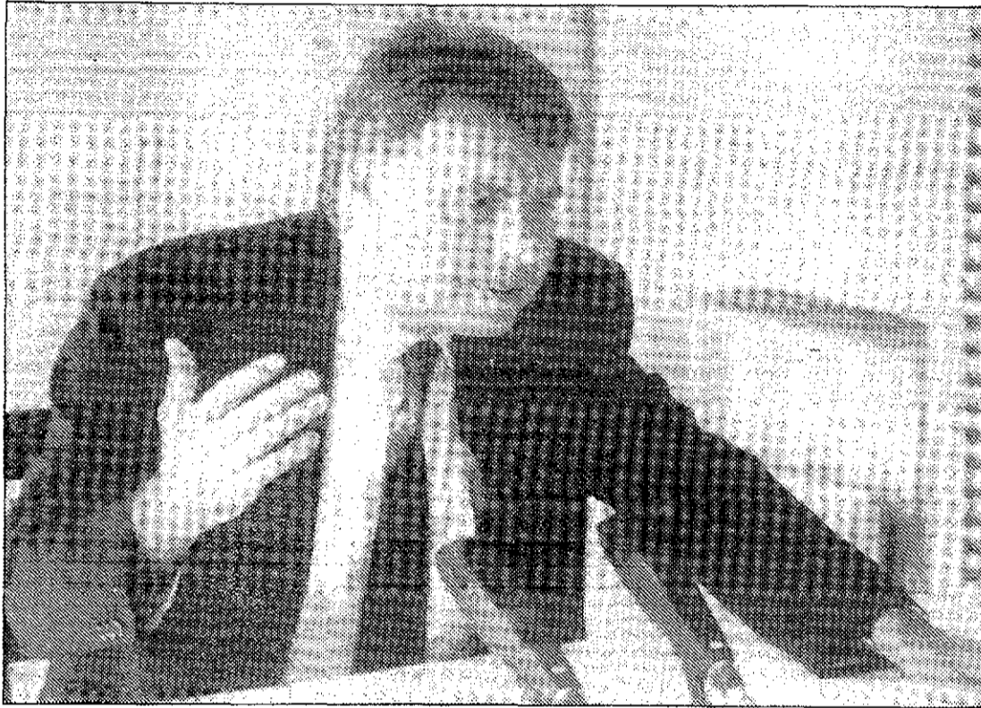
Felipe González, satisfecho del papel de España en el conflicto del Golfo.

Esté nuevo orden pasaría, a juicio de González, «por un mayor protagonismo de Naciones Unidas». Para González resulta ahora imprescindible abordar la situación de la zona de un modo global: «Será imprescindible —dijo— una conferencia