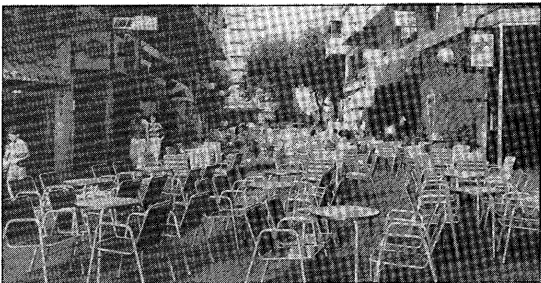
La Policía Municipal, en acción. Mesas y sillas, retiradas en la calle Bartolomé Pérez Casas.