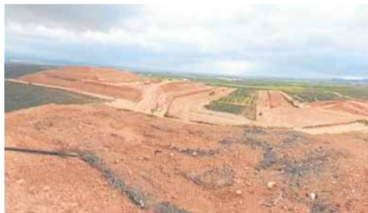
Emplazamiento de la ampliación del vertedero. s.s.

La ampliación está diseñada para dar continuidad a la actividad actual, según las nuevas previsiones de entrada de residuos, que alcanzan las 520.000 toneladas al año. La inversión total prevista en la memoria técnica, a la que ha tenido acceso La Verdad, asciende a 2.387.618 euros.