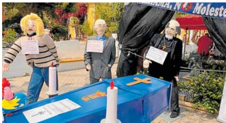
Uno de los mayos colocado en un parque de Alhama de Murcia, ayer.

hoy en día siguen la misma dinámica, pero en este caso con carteles con leyendas alusivas a las tradiciones, costumbres y temas de actualidad. En esta ocasión, varias de esas escenas hacían alusión al cambio de vida de un pueblo, del que muchos opinan que cada vez más es una ciudad dormitorio. En total, se instalaron por asociaciones, grupos de amigos y familias 27 mayos, repartidos por todo el casco urbano, aunque la zona que era todo un bullicio fue la del centro