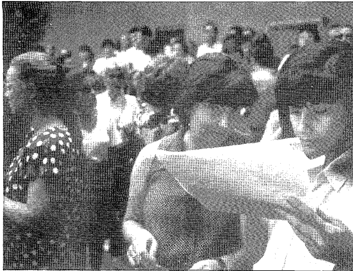
El pequeño drama de elegir destino Los profesores que se disponen a iniciar el nuevo curso escolar eligieron ayer por la mañana sus destinos, en el Saavedra Fajardo . Los profesores optan a elegir entre una lista de centros y poblaciones. El acto de adjudicación de destinos reproduce cada año pequeños dramas y conflictos personales. En la foto de JUAN LEAL, dos profesoras estudian las localizaciones más convenientes.