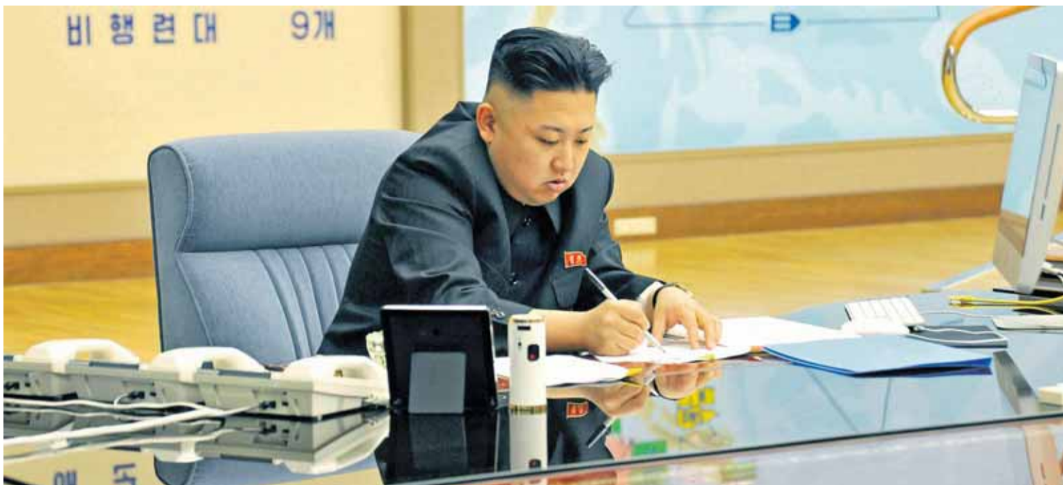
El líder norcoreano, Kim Jong-un, durante la reunión en la que ordenó a su Ejército que preparara los misiles.