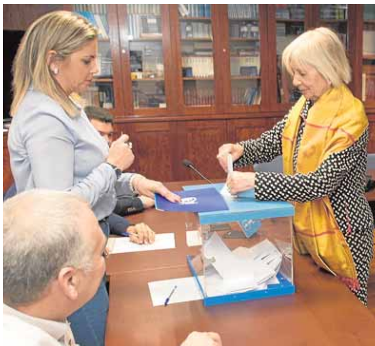
Una afiliada del PP vota en la sede regional, en las primarias para elegir al presidente del partido, el pasado 12 de marzo.

censo de afiliados, señala que se realiza una gestión periódica sobre quién paga o no paga las cuotas, sobre todo en los meses previos a un congreso regional, como el que se celebró en Murcia en marzo pasado, por lo que debería estar actualizado.