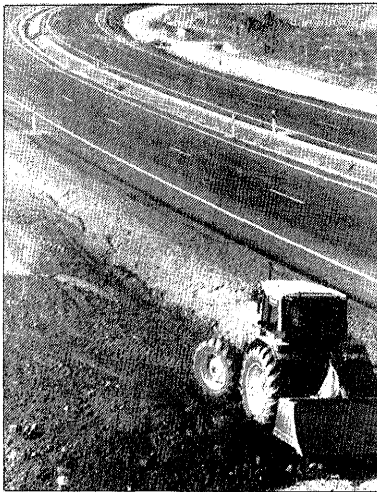
El tramo se abrirá al tráfico pasado mañana.

La apertura de este nuevo tramo supone, en palabras de López Ruiz, que el turismo de esta zona «tenga resueltas sus comunicaciones». La autovía de La Manga ha supuesto un coste total de 2.700 millones de pesetas, con cargo a las arcas autonómicas. La obra se considera, técnicamente, un desdoblamiento, de tal suerte que tiene pendiente todavía las instalaciones de cerramiento y la habilitación de pasos elevados para peatones.