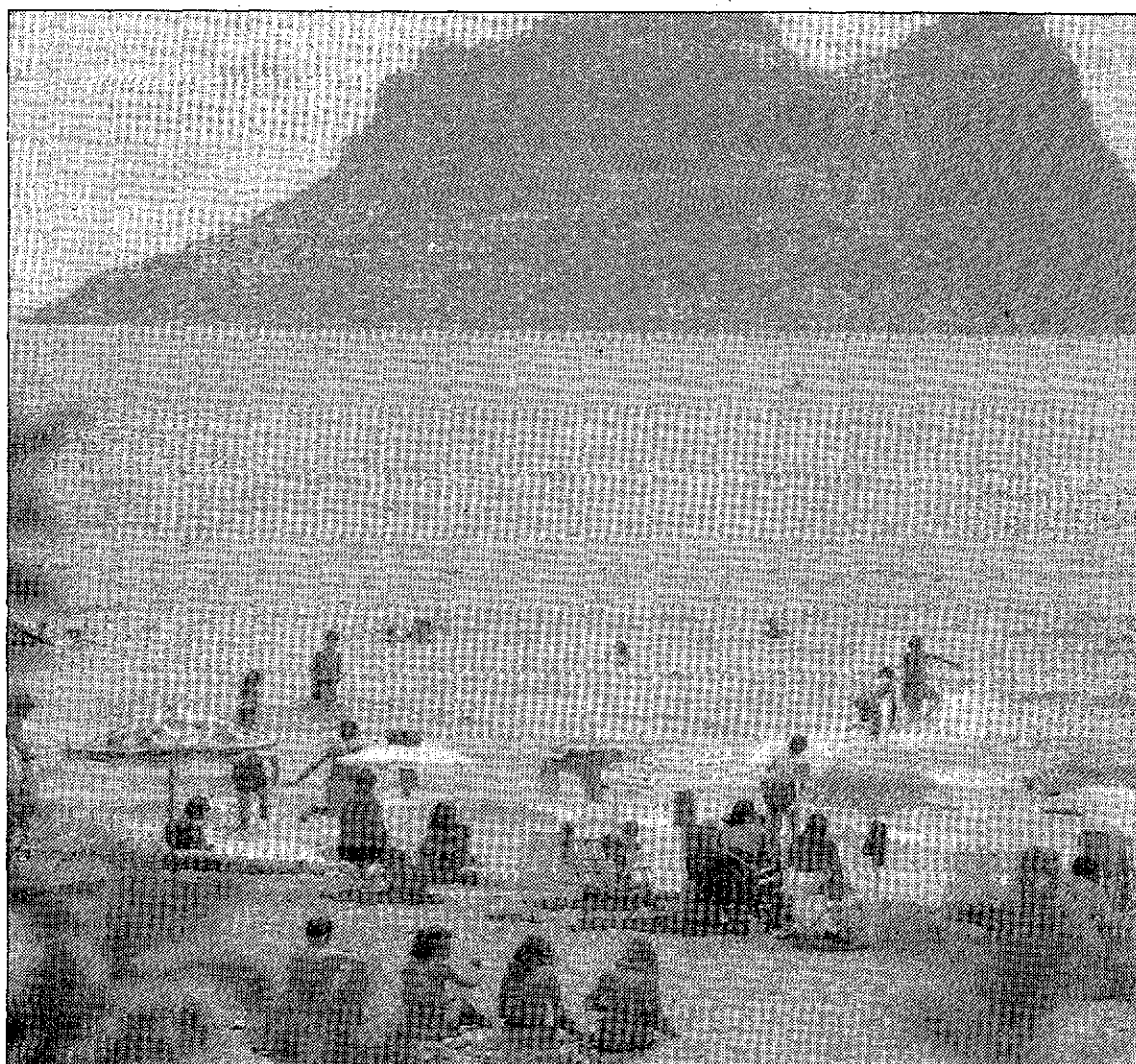
La aguilena playa del Hornillo. Al fondo se aprecia la isla del Fraile.

También indicó que en el proyecto inicial iba un puente sobre la rambla del Rubial, puente que finalmente no se llevó a cabo.